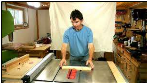
Sierra Circular sin Resguardos

Un Trabajador se encontraba preparando una pieza de madera (80cm* 8cm*6cm) en una sierra circular de mesa la cual no disponía de resguardo de seguridad; al momento que el trabajador hace presión de la pieza contra el disco de corte, esta retrocede provocando que el disco de la sierra circular corte tres de los dedos de la mano izquierda del trabajador.