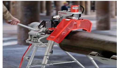
Ranuradora con guarda de seguridad