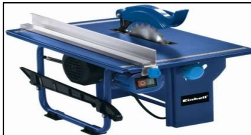
Sierra Circular con resguardos típicos