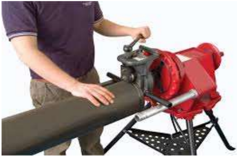
Ranuradora sin guarda

Mientras el trabajador se encontraba realizando trabajos habituales de rectificación con la máquina ranuradora, cuya tarea consiste en colocar la pieza tubular (tubo metálico) debajo del dispositivo ranurador donde la máquina va tallando un canal alrededor del tubo mientras el trabajador gira la palanca manual que se encuentra en la parte delantera de la máquina. Al colocar el trabajador uno de los tubos en la máquina ranuradora su mano derecha cede junto con este y sus dedos medio y anular son aplastados junto con el guante de protección. Como consecuencia de este accidente se generó incapacidad permanente parcial.