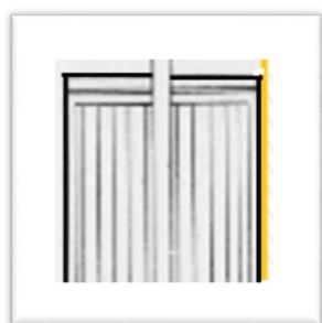
Ascensor de rejillas SIN guardas de seguridad

La trabajadora se encontraba en la planta baja del local, atendiendo un cliente, quién le solicitó una chompa con características específicas (esta se encontraba en el primer piso alto del almacén) e implementos deportivos (se encontraban en el segundo piso alto). Por lo que la trabajadora decide subir por el ascensor (las puertas del ascensor eran a media altura, de rejilla, tipo batiente) llega al primer piso alto, saluda con sus compañeras, recoge la chompa e ingresa nuevamente al ascensor para dirigirse al segundo piso alto, en ese momento sus compañeras escuchan un ruido que proviene del ascensor, se acercan y observan que su compañera estaba atrapada entre el ascensor y la estructura del suelo del segundo piso alto, pues había sacado la cabeza y un brazo por la ventana de la puerta izquierda de la cabina del ascensor. Como consecuencia de este accidente la trabajadora fallece.