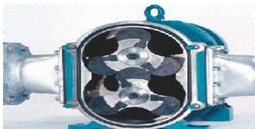
ASPAS METÁLICAS SIN PROTECCIÓN

Mientras el trabajador se encontraba realizando el pesaje de producto congelado de café en el área de pre-cámara, y al percatarse que la máquina de succión no estaba funcionando correctamente, el trabajador decide ir al área de venturi donde se encontraba el succionador sin ninguna orden o previo aviso; para verificar la salida del aire del equipo, este coloca su mano izquierda (estaba utilizando guantes) en el boquete del succionador y esta es succionada hacia las aspás metálicas por lo que sufre cortes en sus dedos. A consecuencia sufre amputación traumática de la 2da y 3ra falange de los dedos índice y medio, generando una incapacidad permanente parcial.