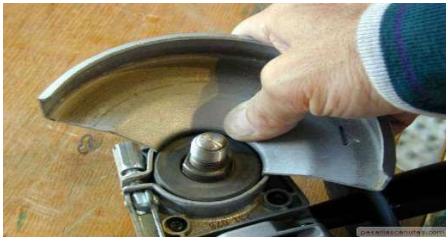
Guarda protectora en amoladora

Por disposición del maestro mayor de la obra, el trabajador procede a cortar una pieza de madera que se encontraba en el piso, tenía 6 centímetros de espesor aproximadamente y estaba sostenida por el pie izquierdo del trabajador con una amoladora, por lo que la amoladora se quiso trabar debido al grosor del tablón, es entonces cuando se suelta de su mano la herramienta quedando activado el seguro de encendido de la amoladora y cae sobre el pie izquierdo ocasionando heridas y lesiones en el pie. Como consecuencia de este accidente se generó incapacidad permanente parcial.