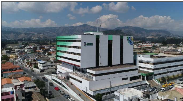
Vista panorámica Hospital General Riobamba

También se detallan los objetivos institucionales así como la ejecución presupuestaria y procesos de contratación de bienes y servicios que se registraron en el periodo 2017 e ingresos de facturación de los diversos servicios que ofrece el hospital. Por otra parte, se informa sobre los logros alcanzados por el hospital y asumidos con la comunidad y cumplimiento de las políticas públicas para la igualdad.