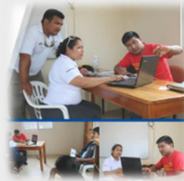
Brigada de Capacitación: Responsabilidad Patronal.