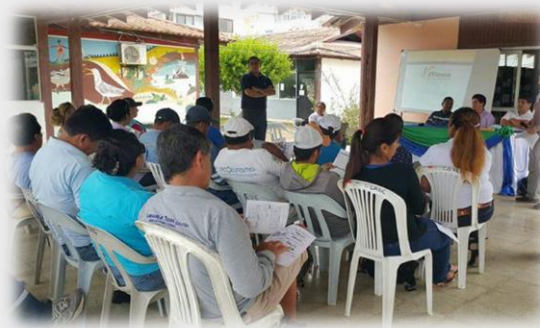
Capacitación preventiva Riesgo de Trabajo.