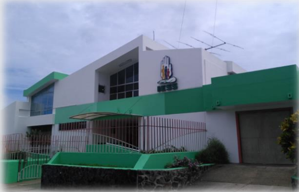
Mejoras de infraestructura.