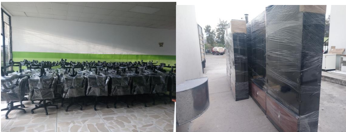
Fuente: Archivo Administración 2017 Elaborado por: Dirección Administrativa – Hospital General Ibarra