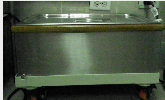
TANQUESA DE PARAFINA