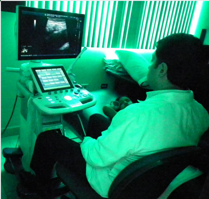
ECÓGRAFO CON TRANSDUCTOR CARDÍACO