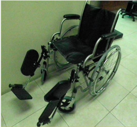
SILLA DE RUEDAS