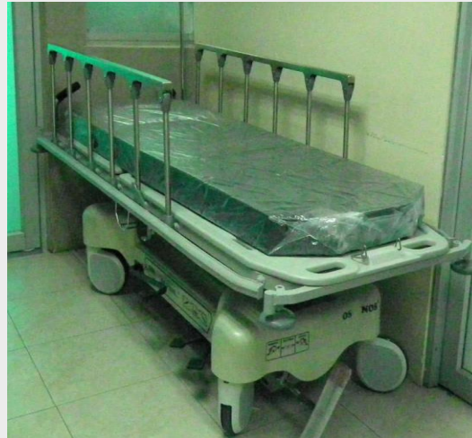
CAMILLA DE TRANSPORTE