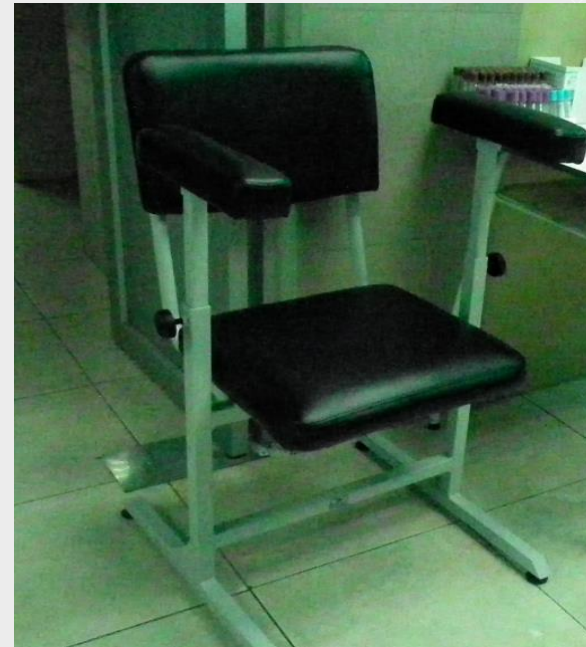
MESAS DE EXTRACCIÓN DE SANGRE