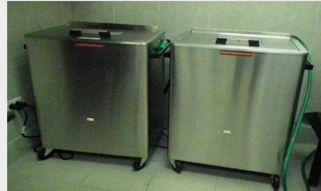
TANQUE DE COMPRESA CALIENTE