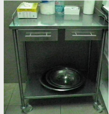
COCHE DE CURACIONES