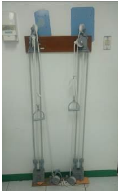
Ilustración 3 Juego de poleas