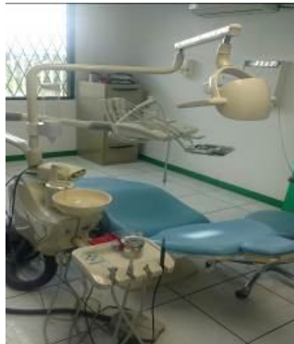
Ilustración 1. Unidad Odontológica Completa

Se realizó la reposición de equipos y maquinarias necesarios para el buen desempeño de los servicios de la Unidad Médica, como una Unidad Odontológica Completa tipo Colibrí, Ecógrafo, juegos de compresas frías, juego de cuñas, juego de poleas, juego de pesas y escalerilla de dedos para las áreas de Medicina General, de Enfermería, Rehabilitación Física y la Sala de Espera.