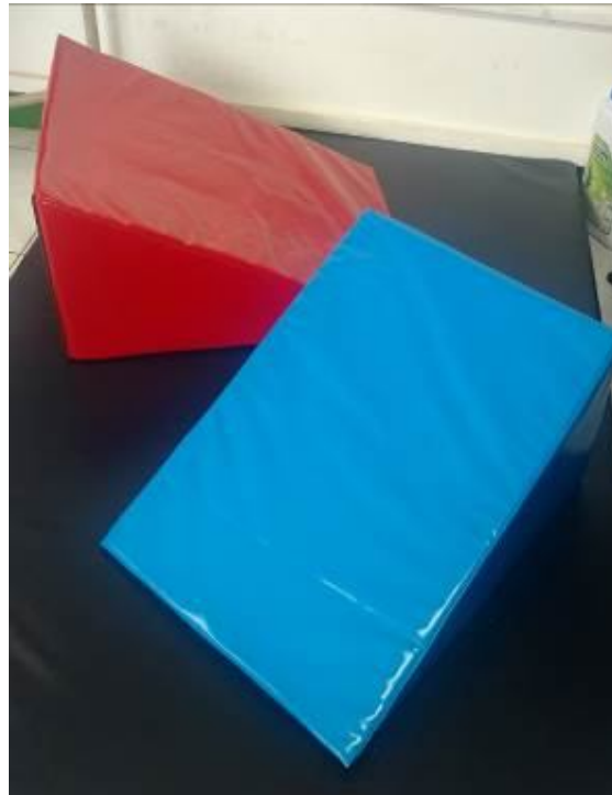
Ilustración 5 Juego de cuñas