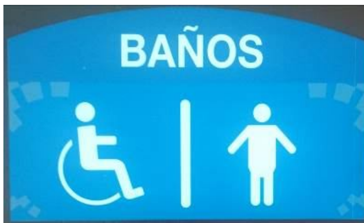
Ilustración 11 Señalética de baños