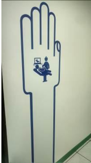
Ilustración 9 Señalética de Cartera de servicios