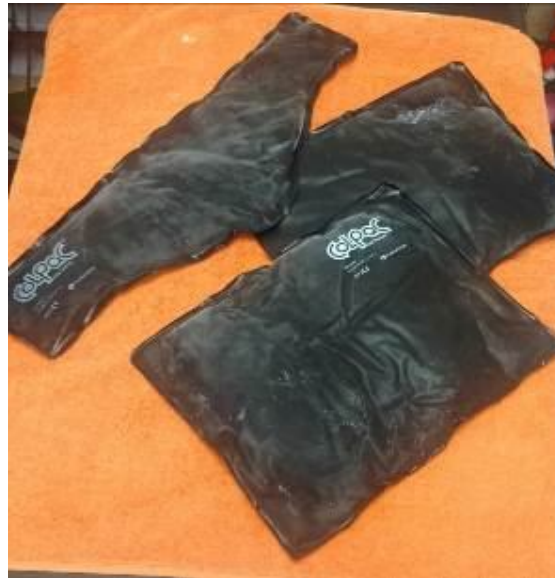
Ilustración 6 Juego de compresas frías