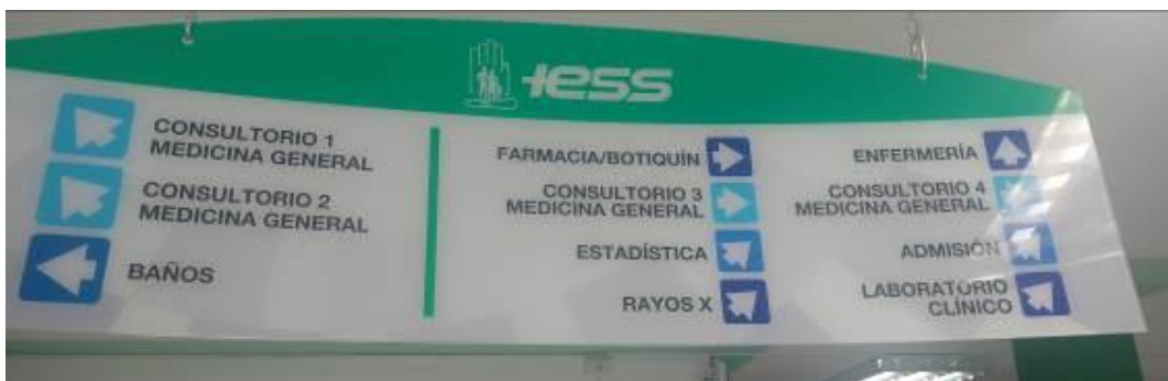
Ilustración 10 Rótulo de identificación de áreas