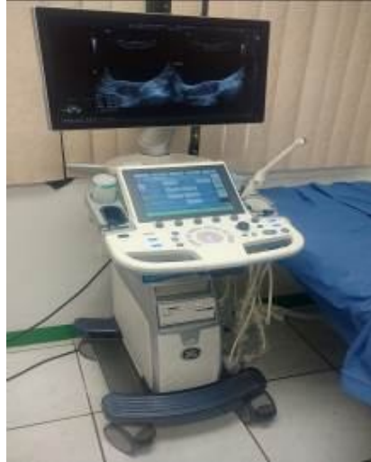
Ilustración 2 Ecógrafo