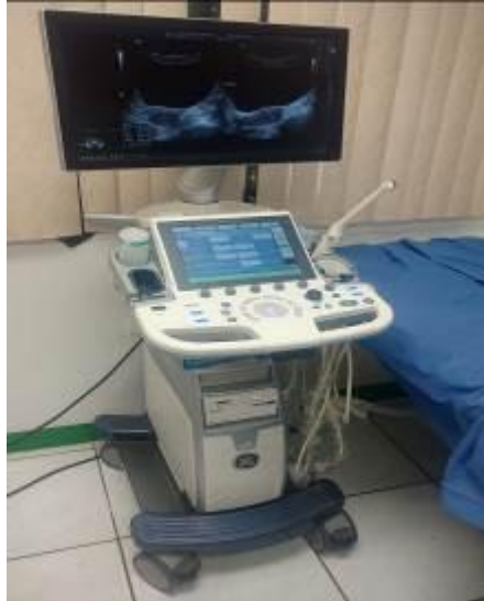
Ilustración 2 Ecógrafo