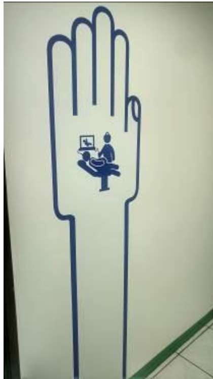
Ilustración 9 Señalética de Cartera de servicios