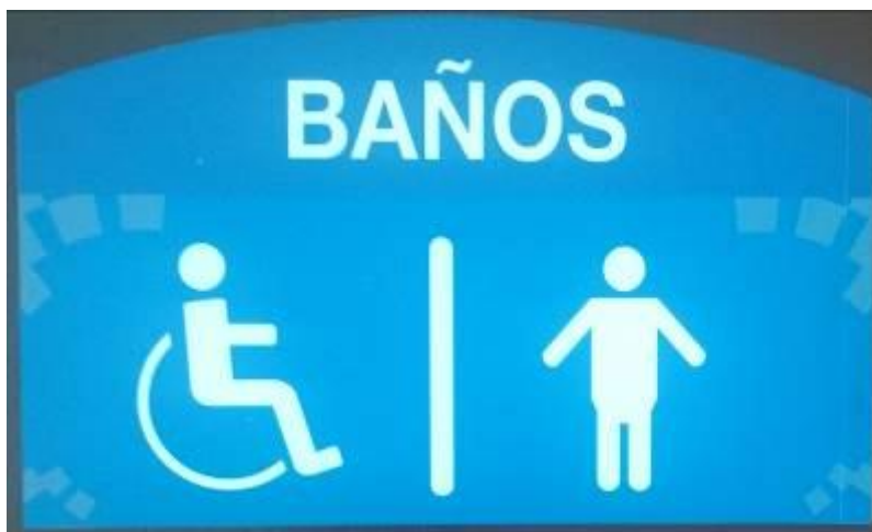
Ilustración 11 Señalética de baños