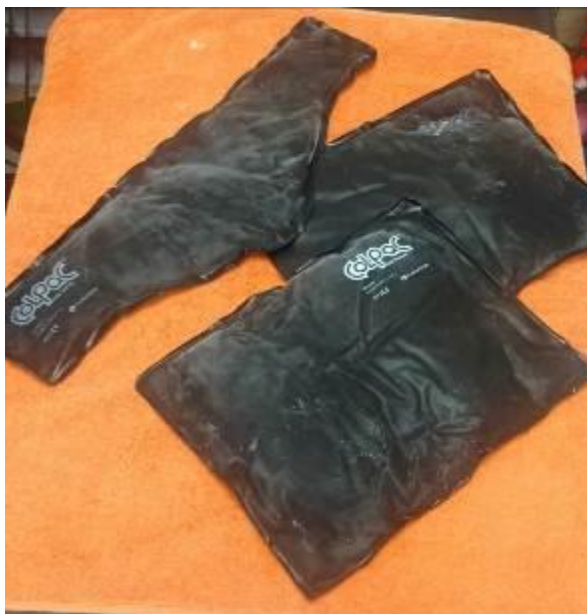
Ilustración 6 Juego de compresas frías