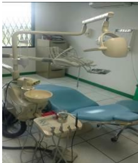
Ilustración 1. Unidad Odontológica Completa

Se realizó la reposición de equipos y maquinarias necesarios para el buen desempeño de los servicios de la Unidad Médica, como una Unidad Odontológica Completa tipo Colibrí, Ecógrafo, juegos de compresas frías, juego de cuñas, juego de poleas, juego de pesas y escalerilla de dedos para las áreas de Medicina General, de Enfermería, Rehabilitación Física y la Sala de Espera.