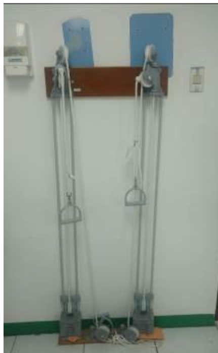
Ilustración 3 Juego de poleas