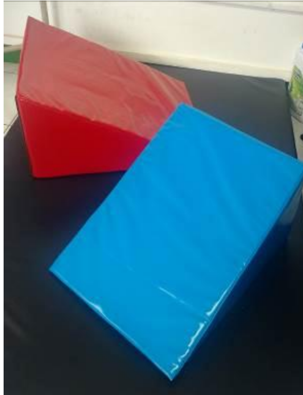
Ilustración 5 Juego de cuñas