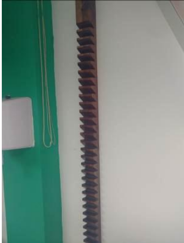
Ilustración 8 Escalerilla para dedos