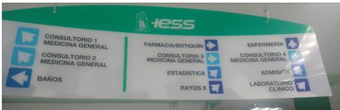
Ilustración 10 Rótulo de identificación de áreas