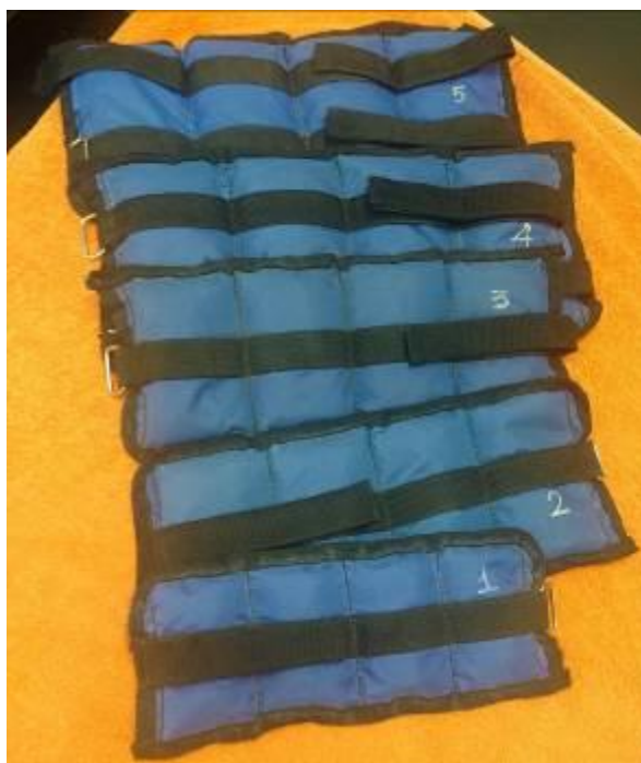
Ilustración 7 Juego de pesas