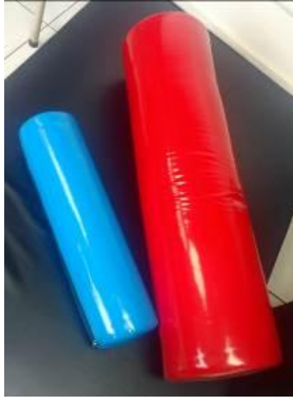
Ilustración 4 Juego de Rodillos