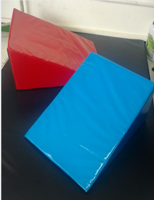
Juego de cuñas