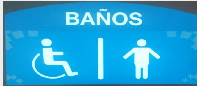
Señalética de baños