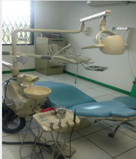
Unidad Dental Completa tipo colibrí