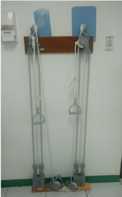
Juego de poleas