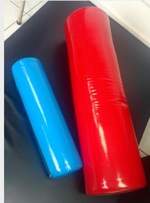
Juego de rodillos