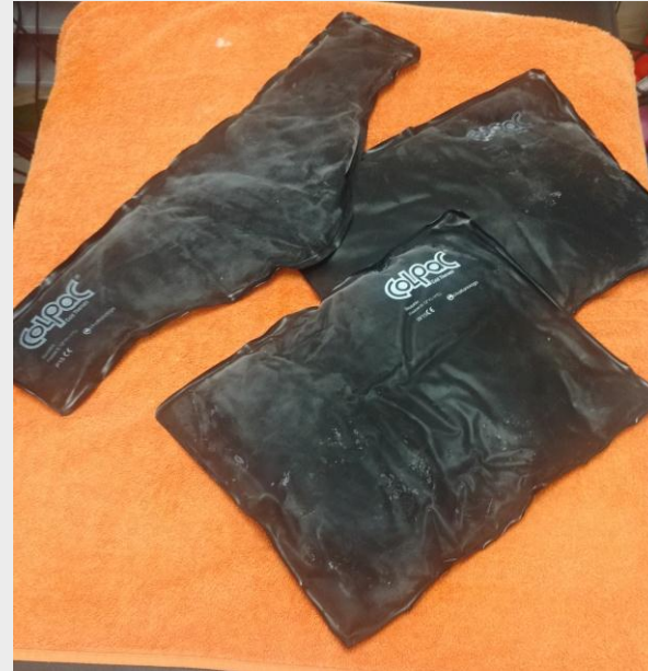
Juego de compresas frías