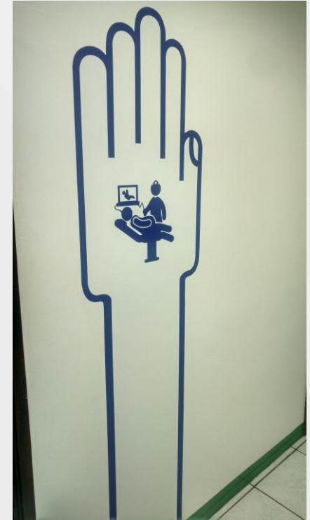
Señalética de Cartera de servicios