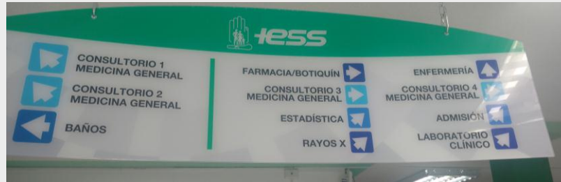
Señalética identificación de áreas