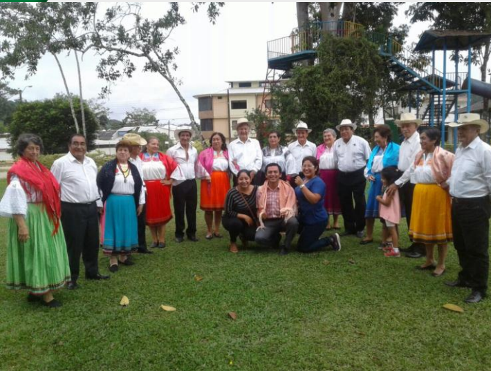
Día del Adulto Mayor