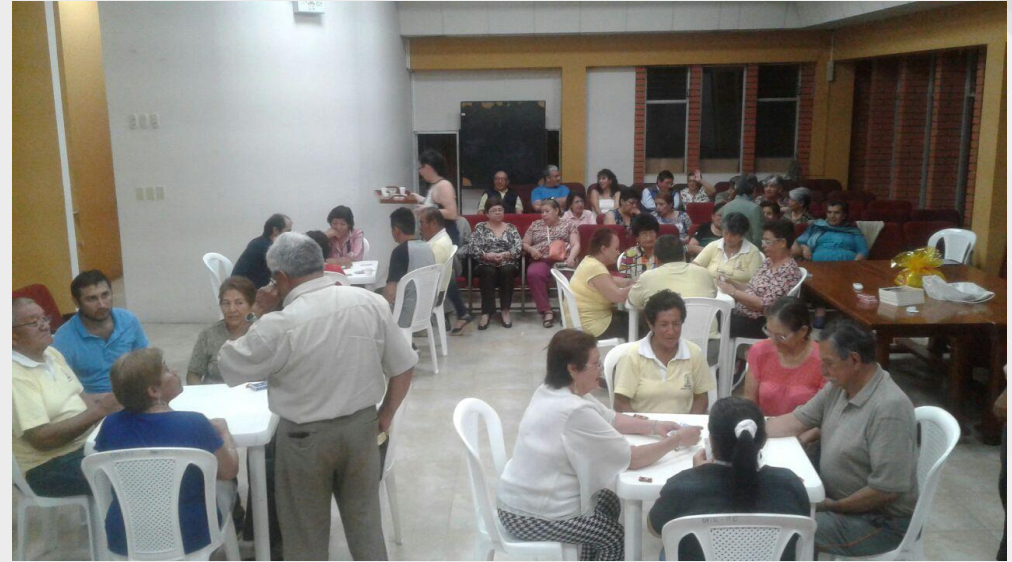
Jubilados: Gualaquiza - Cuenca