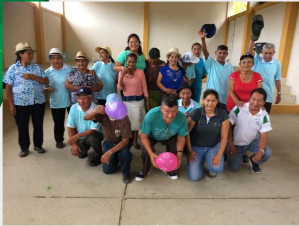
Fisioterapia Nueva Tarqui