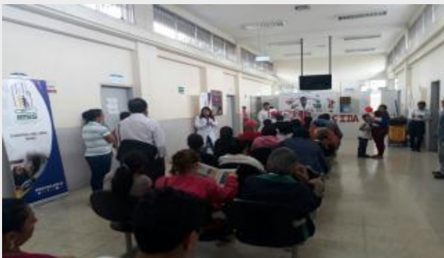
Fomentar la prevención de la salud