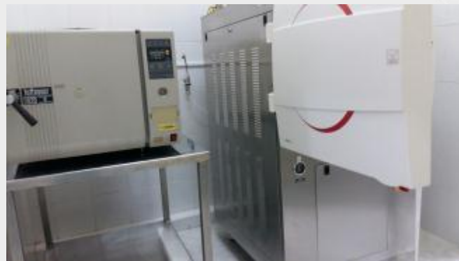
Central de Esterilización