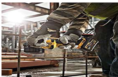
Moladora con guarda de seguridad

Por disposición de su jefe, el trabajador se dispuso a cortar varillas de 10mm que se encontraban salidas sobre la vía en posición vertical. Como no tenía disco de corte, el trabajador trae 2 discos que sus compañeros estaban utilizando para trabajar con la moladora. El primer disco se rompe en tres pedazos luego de ser instalado en la máquina aun sin utilizarlo; posteriormente coloca el segundo disco y prueba la moladora sin carga, como se encontraba bien colocado el disco y la guarda en la moladora procede a realizar el primer corte a la varilla, cuando al terminar de hacer este corte siente un golpe en su ojo izquierdo y observa un charco de sangre en el piso por lo que se tapa su ojo derecho y se da cuenta que con el ojo izquierdo no podía ver, inmediatamente solicita ayuda a su compañero y es trasladado a un centro médico donde es operado de su ojo. Por este accidente se generó una incapacidad permanente parcial.