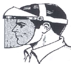
Equipo de protección adecuada para cara