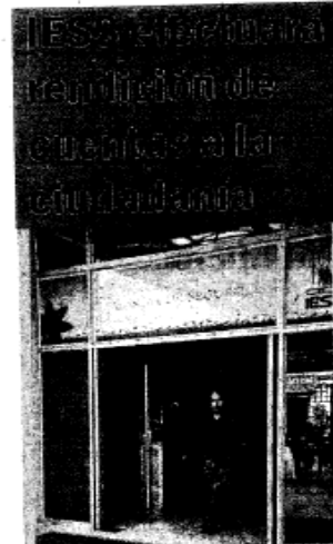
El acto de rendición de cuentas del IESS será el miércoles 11 de febrero a las 10:00.