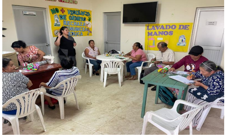
Fotografía 8: Taller de manualidades con adultos mayores y asegurados del Seguro Social Campesino