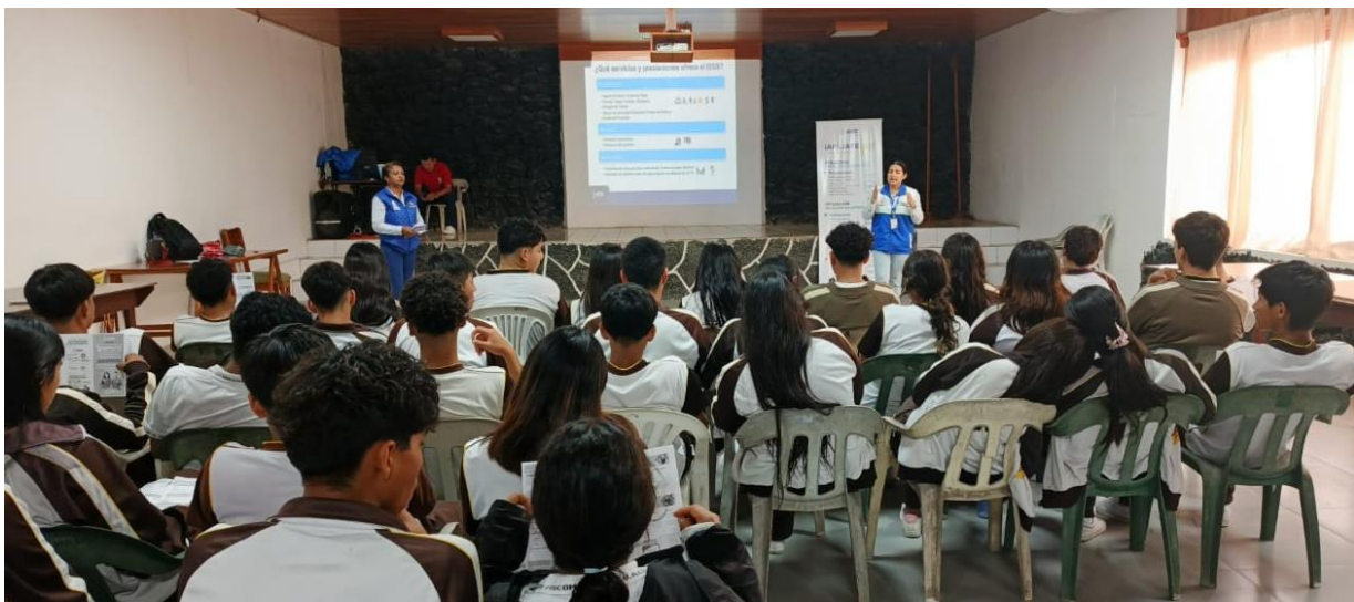
Fotografía 3: Jornada de capacitación en cultura previsional a estudiantes de colegio en el cantón Isabela