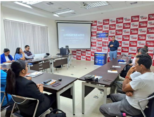
Fotografía 9: Capacitación en Riesgos del Trabajo y salud ocupacional en el cantón San Cristóbal