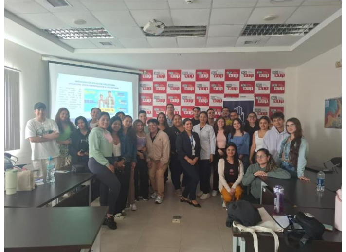
Fotografía 2: Jornada de capacitación en modalidades de afiliación, servicios y beneficios del IESS en San Cristóbal