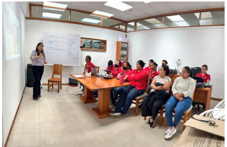
Fotografía 10: Capacitación en Riesgos del Trabajo y salud ocupacional en el cantón Santa Cruz