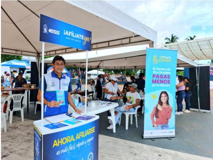
Fotografía 1: Jornada Itinerante “Afiliate Ya” en el cantón Santa Cruz