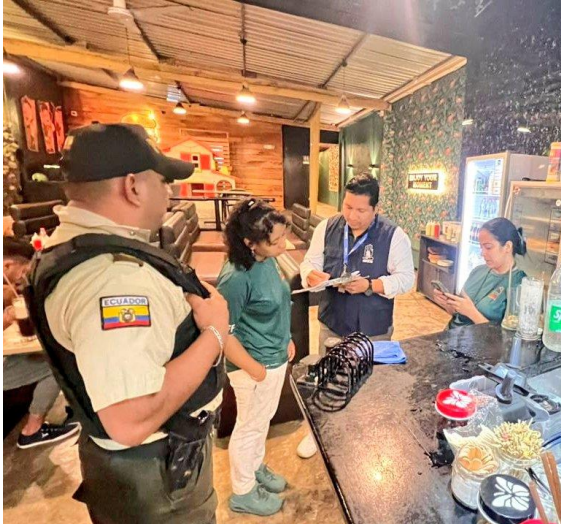
Fotografía 4: Proceso de inspección en establecimiento de Santa Cruz