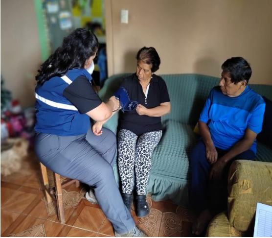
Fotografía 7: Visitas domiciliarias de atención médica