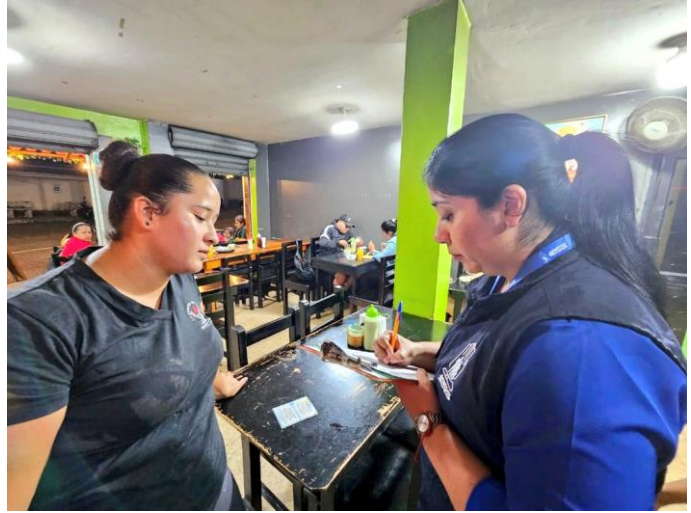
Fotografía 5: Proceso de inspección en establecimiento de San Cristóbal