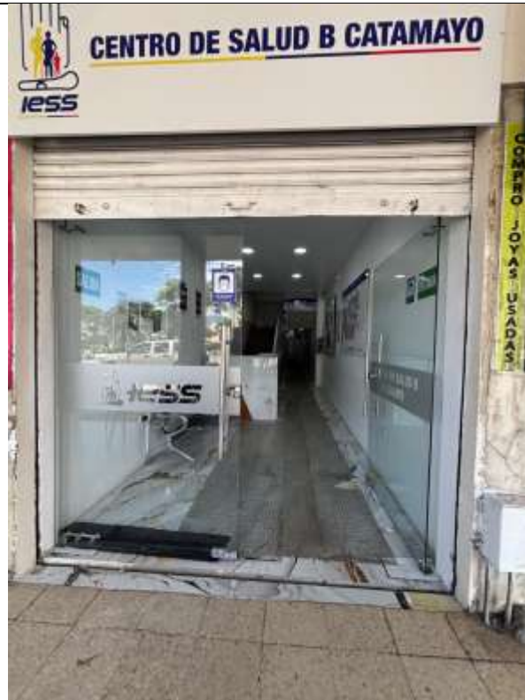
ACCESO A LA UNIDAD MEDICA