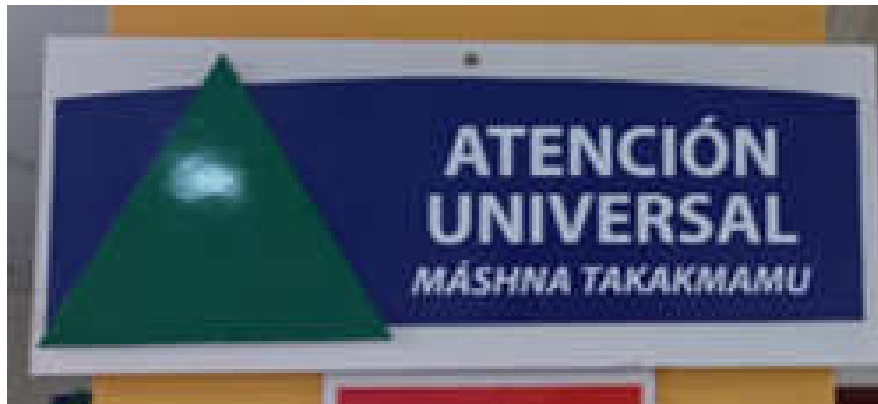
Imagen 10. Señalética en castellano y shuar.