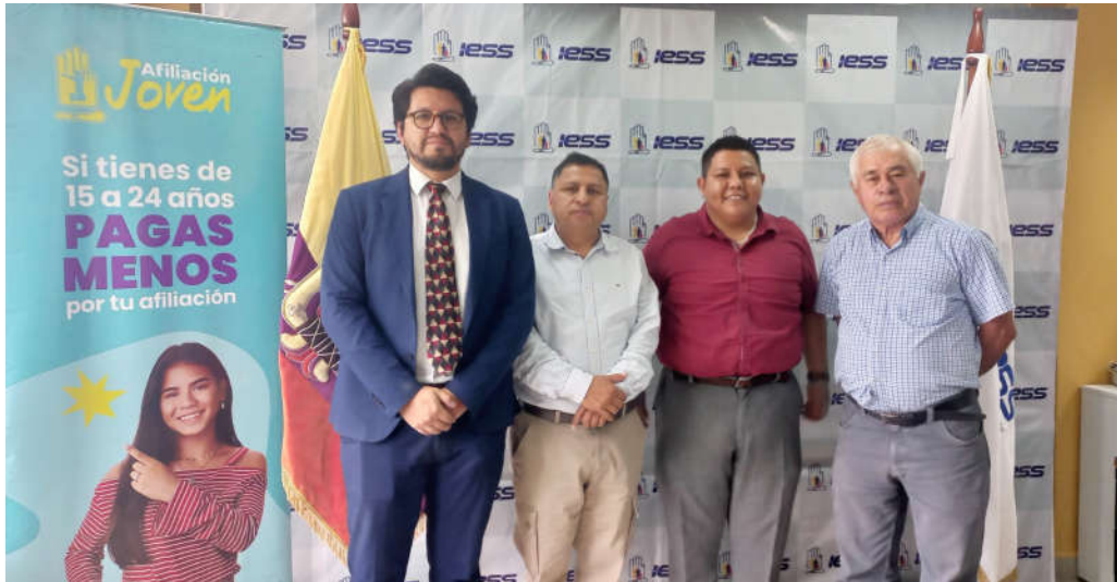
Imagen 5. Firma de Instrumento Técnico con Sindicatos de Choferes.