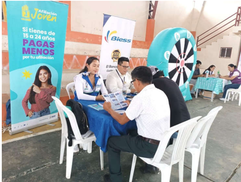
Imagen 7. Promoción de los beneficios y prestaciones de la Seguridad Social.