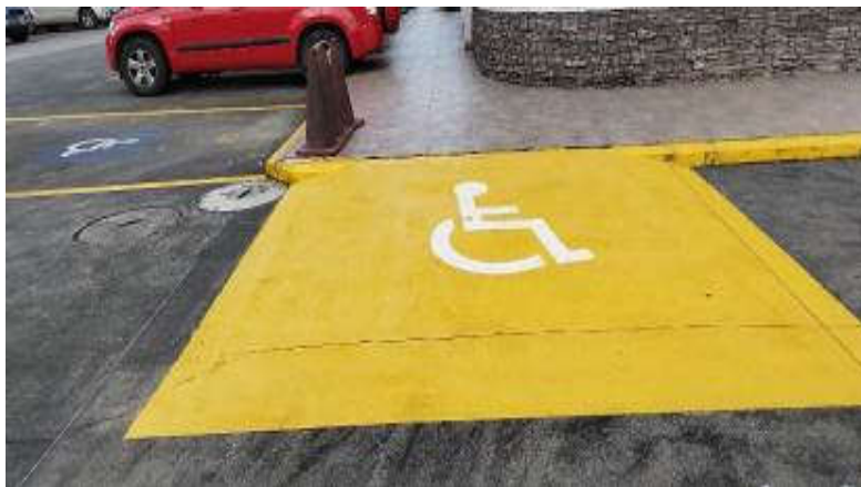
Imagen 11. Rampas y señalética para personas con discapacidad.