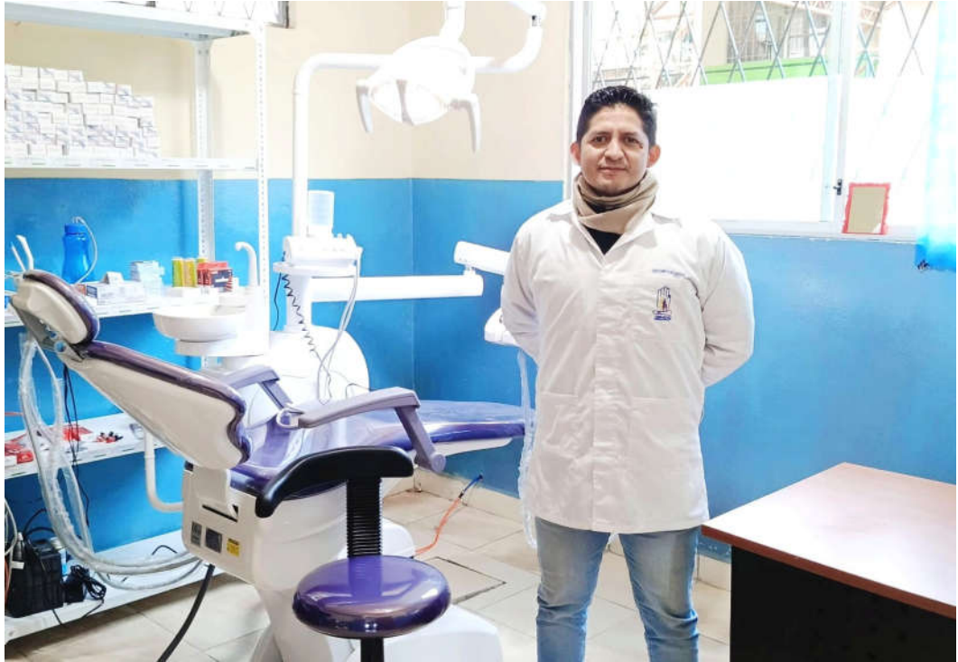
Imagen 9. Entrega de nuevos sillones odontológicos SSC.