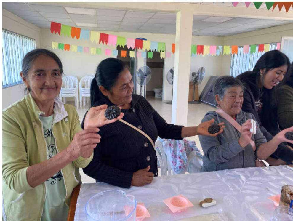
Imagen 8. Capacitación a Adultos Mayores.