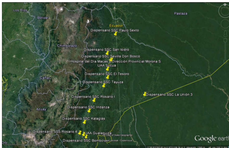
Imagen 1. Cobertura SSC Morona Santiago.