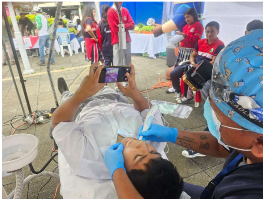
Imagen 6. Brigadas de atención directa a la ciudadanía.