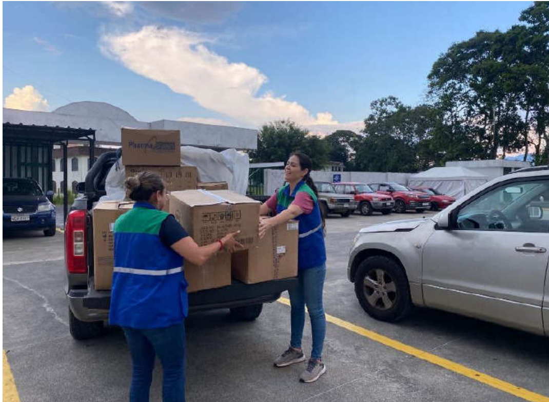
Imagen 2. Abastecimiento médico.