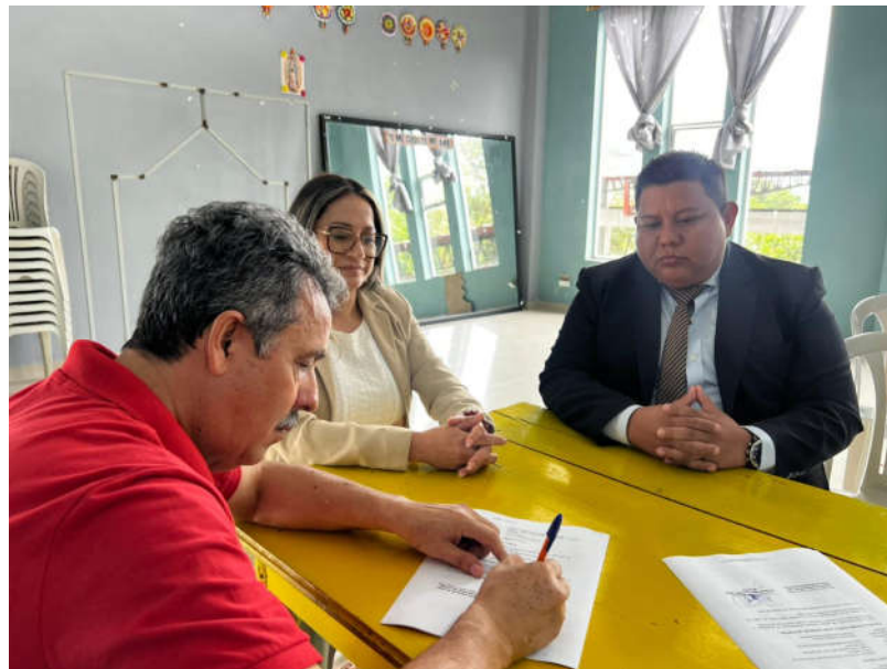
Imagen 4. Firma de convenio interinstitucional con el Municipio de Limón Indanza.