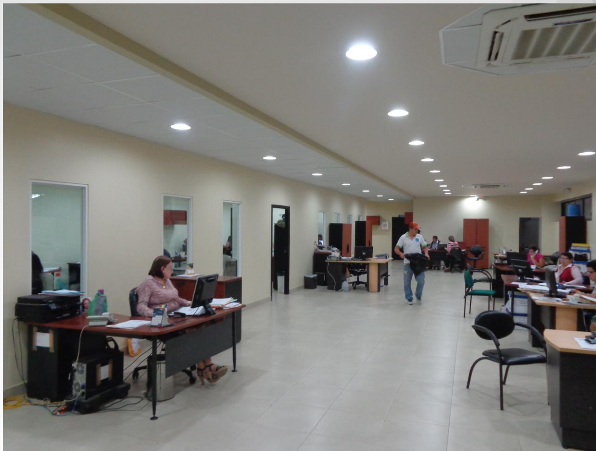
Readecuación de la Subdirección Provincial de Prestaciones del Seguro de Salud de Manabí