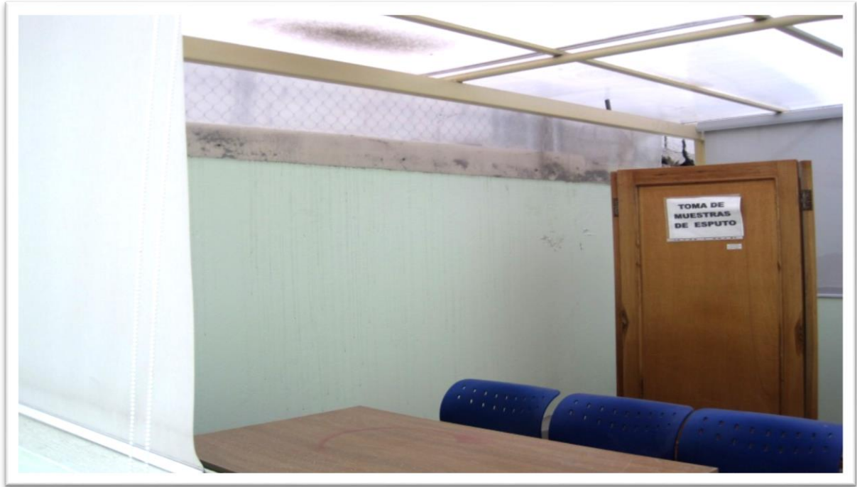
CONSTRUCCION DEL AREA PARA EL PROGRAMA DOTS (CAPTACION MUESTRAS TB)