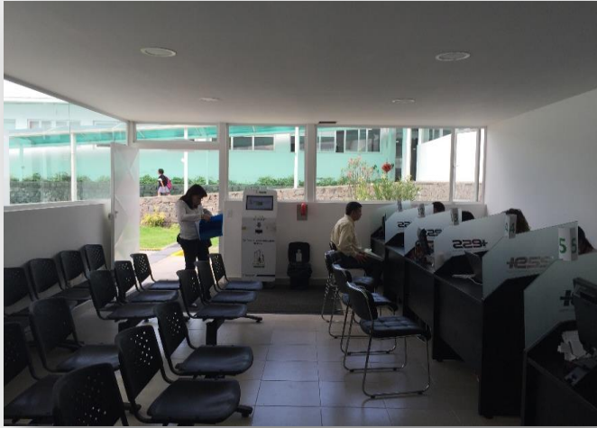
CENTRO DE ATENCIÓN AMBULATORIA EL BATÁN