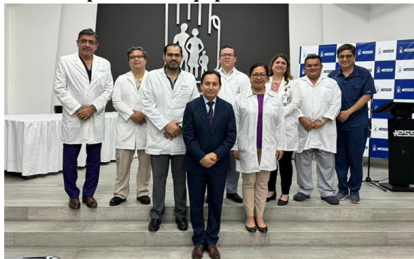
Ilustración 17 - Reposición de equipamiento médico

Elaboración: Hospital de Especialidades Teodoro Maldonado Carbo