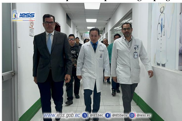
Elaboración: Hospital de Especialidades Teodoro Maldonado Carbo