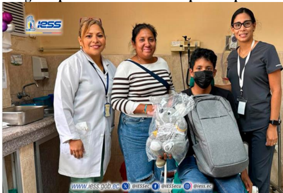
Ilustración 3 - entrega de procesadores externos para implantes cocleares

Elaboración: Hospital de Especialidades Teodoro Maldonado Carbo