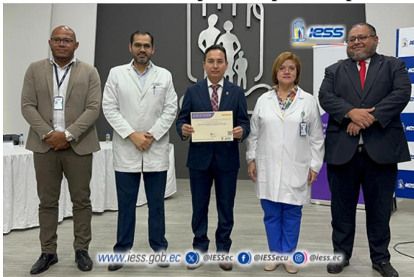
Elaboración: Hospital de Especialidades Teodoro Maldonado Carbo