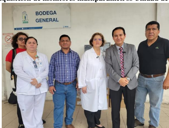
Elaboración: Hospital de Especialidades Teodoro Maldonado Carbo