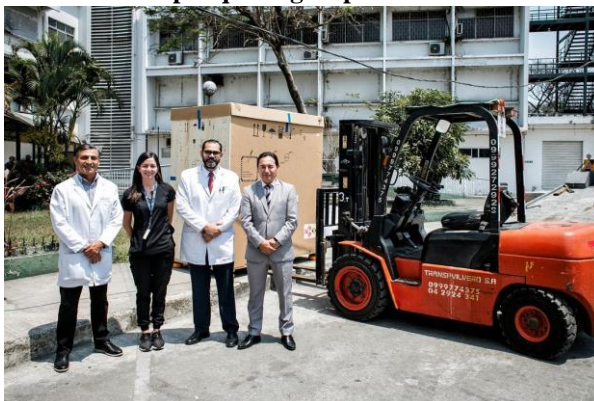
Ilustración 14 - Adquisición de Microscopio quirúrgico para la Unidad Técnica de Neurocirugía

Elaboración: Hospital de Especialidades Teodoro Maldonado Carbo