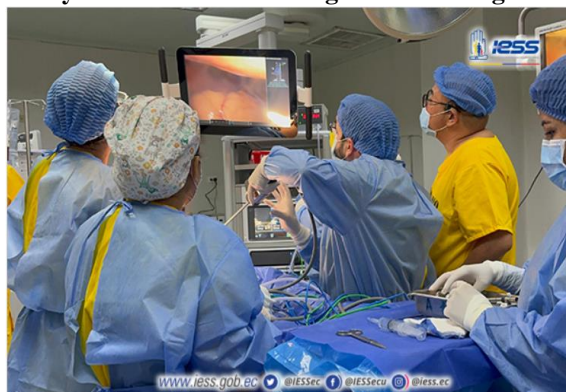
Ilustración 6 - Implementación y consolidación del Programa de Cirugía Robótica en el HTMC

Elaboración: Hospital de Especialidades Teodoro Maldonado Carbo