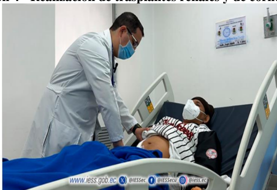
Ilustración 4 - Realización de trasplantes renales y de córnea

Elaboración: Hospital de Especialidades Teodoro Maldonado Carbo