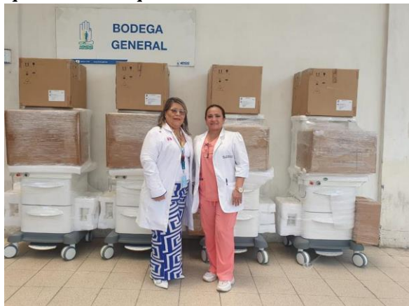
Elaboración: Hospital de Especialidades Teodoro Maldonado Carbo