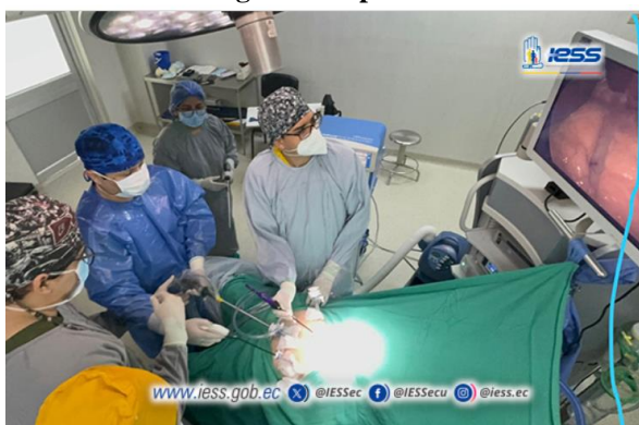
Ilustración 11 - Cirugías de implantes cocleares

Elaboración: Hospital de Especialidades Teodoro Maldonado Carbo