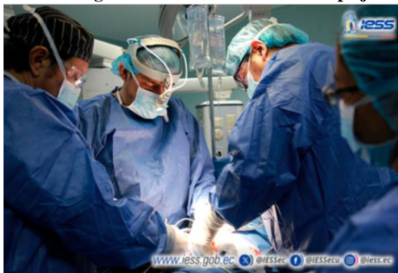
Ilustración 5 - Cirugía cardiovascular de alta complejidad

Elaboración: Hospital de Especialidades Teodoro Maldonado Carbo