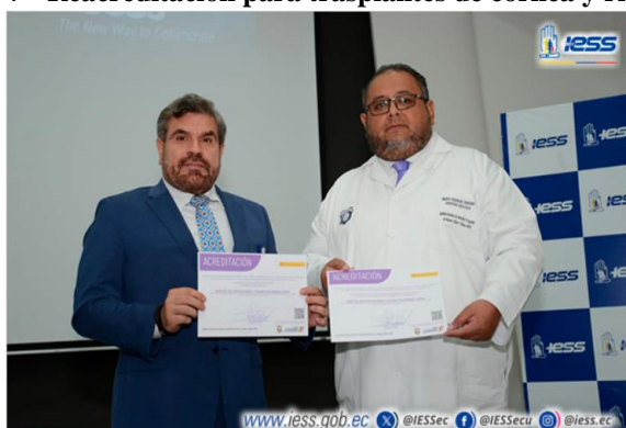
Ilustración 7 - Reacreditación para trasplantes de córnea y riñón

Elaboración: Hospital de Especialidades Teodoro Maldonado Carbo