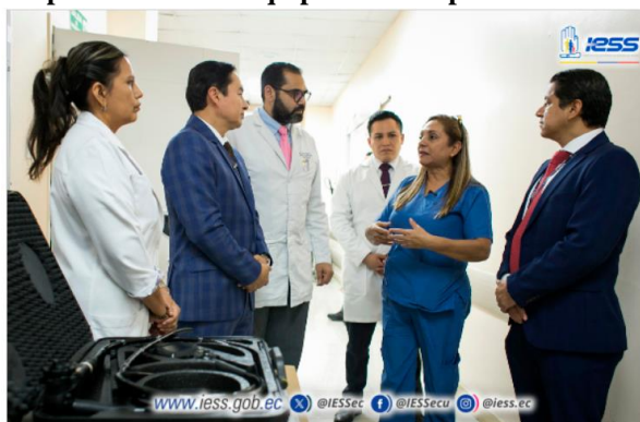
Ilustración 12 - Repotenciación de equipos endoscópicos de alta tecnología

Elaboración: Hospital de Especialidades Teodoro Maldonado Carbo