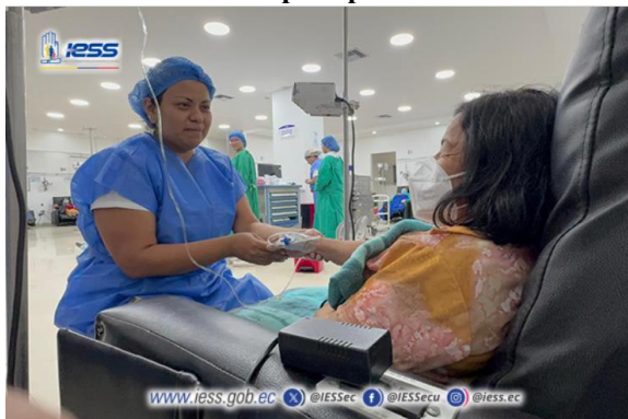
Ilustración 8 - Tratamiento innovador para pacientes con cáncer de pulmón

Elaboración: Hospital de Especialidades Teodoro Maldonado Carbo