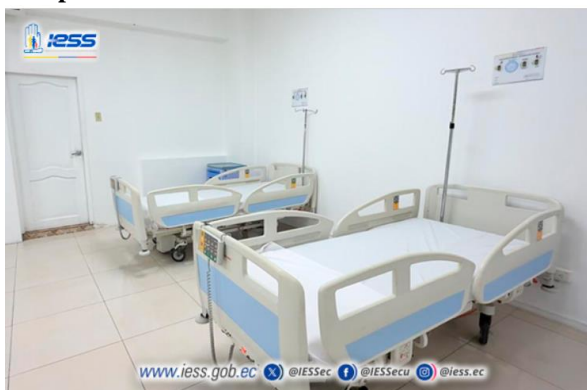
Ilustración 13 - Implementación de la Unidad de Insuficiencia Cardíaca

Elaboración: Hospital de Especialidades Teodoro Maldonado Carbo