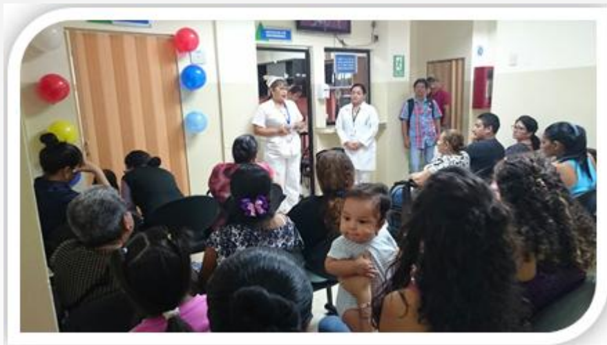
Día Mundial de la Salud, exposición alimentación saludable.