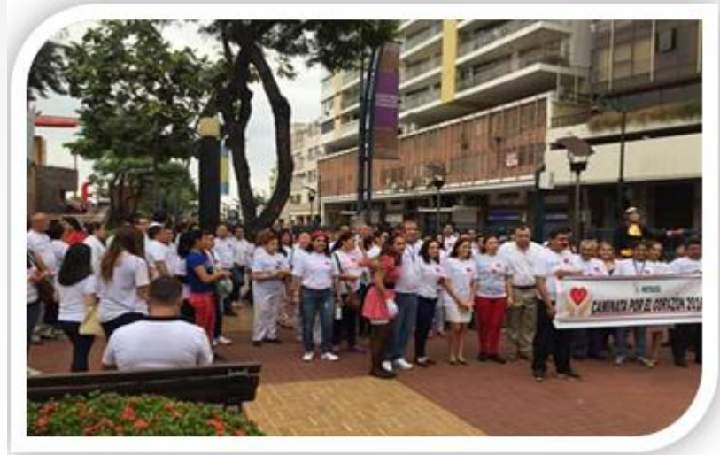
Día Mundial del Corazón, caminata corazón sano Malecón 2000