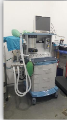
Máquina de anestesia