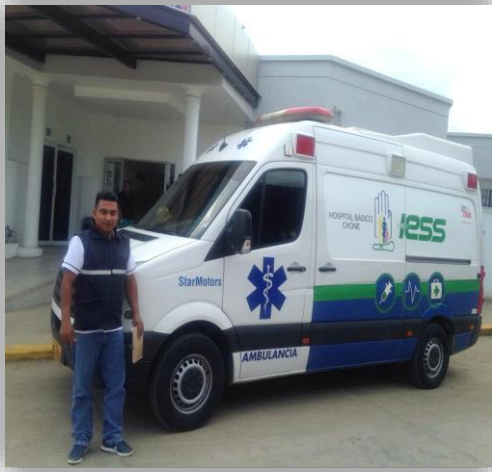
Ambulancia clínica móvil