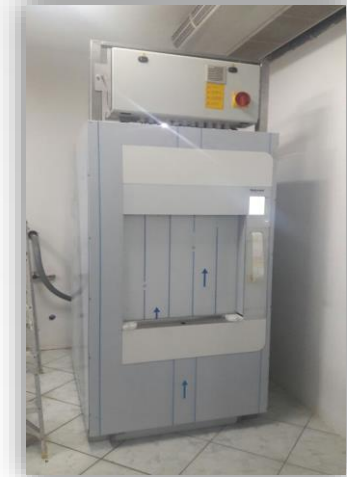
Esterilizador a vapor