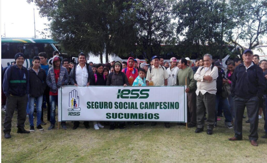
Quinto encuentro intercultural del Seguro Social Campesino