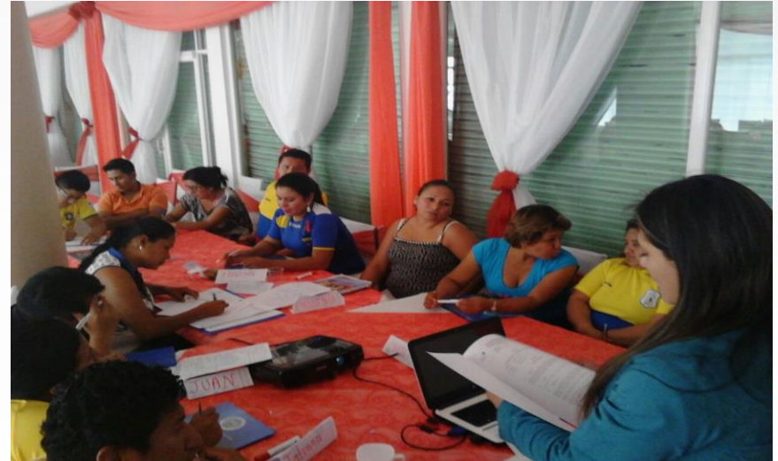
Capacitación a personal operativo del Seguro Social Campesino