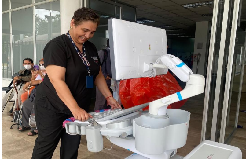
Elaboración: Hospital de Especialidades Teodoro Maldonado Carbo