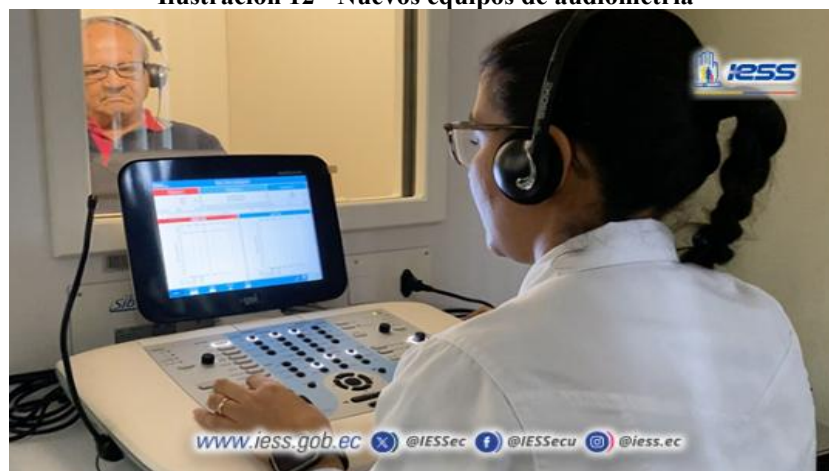
Elaboración: Hospital de Especialidades Teodoro Maldonado Carbo