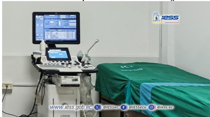
Elaboración: Hospital de Especialidades Teodoro Maldonado Carbo