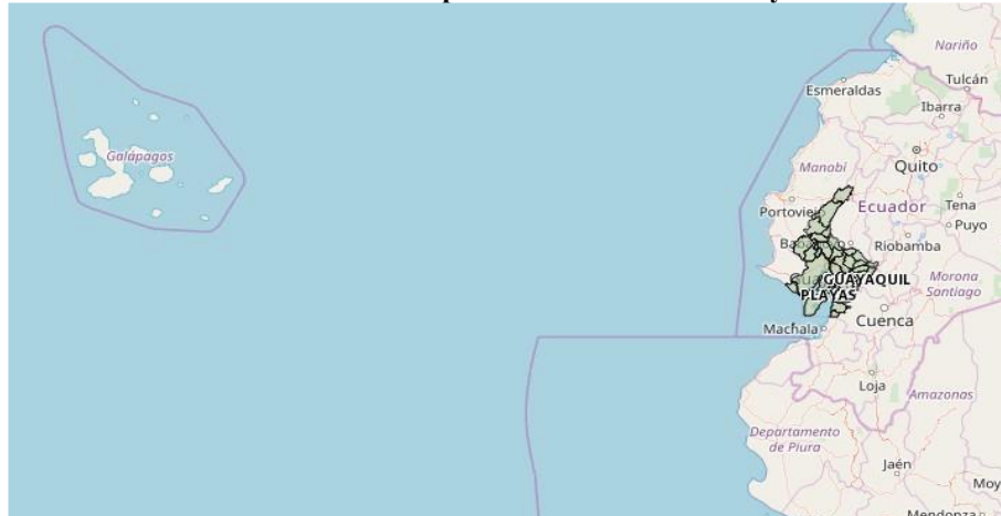
Ilustración 2 - Mapa Geo referencial zona 5 y 8

total tiene un área de extensión de 33.416,67 km 2 que corresponde al 12% del territorio nacional. La zona 8, se encuentra al suroccidente del Ecuador, en la región Costa, provincia del Guayas conformada por los cantones Guayaquil, Samborondón y Durán.