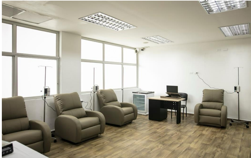
Ilustración 14 - Primera Sala de Neuroinmunología

Elaboración: Hospital de Especialidades Teodoro Maldonado Carbo