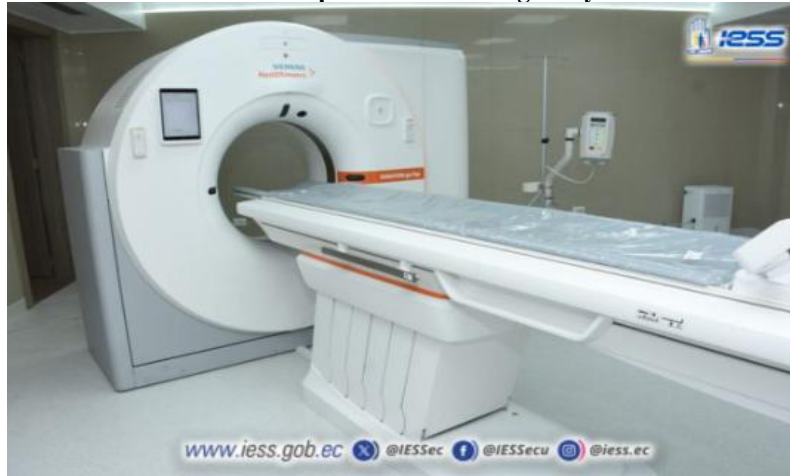
Elaboración: Hospital de Especialidades Teodoro Maldonado Carbo