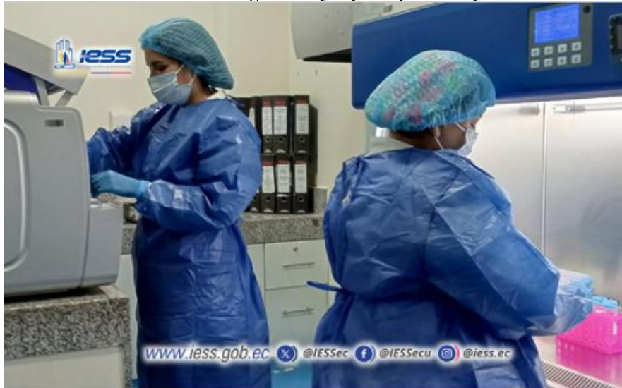
Elaboración: Hospital de Especialidades Teodoro Maldonado Carbo