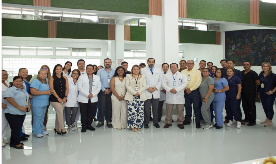
Ilustración 3 - Climatización hospitalaria e inauguración de cocina - comedor institucional