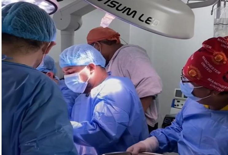
Ilustración 15 - Trasplante hepático

Elaboración: Hospital de Especialidades Teodoro Maldonado Carbo