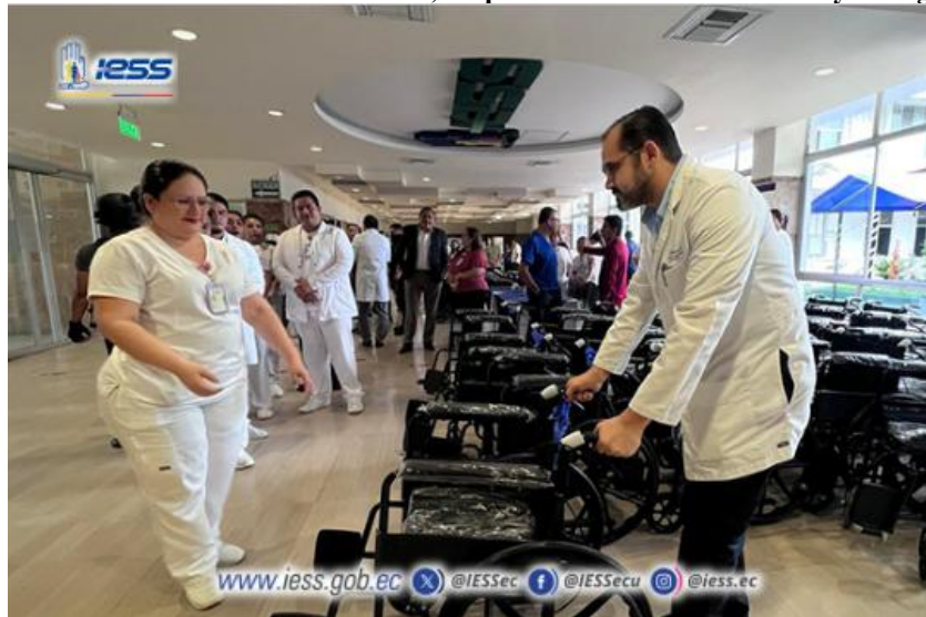
Ilustración 4 – Atenciones de fin de semana, adquisición de sillas de ruedas y laringoscopios.

Elaboración: Hospital de Especialidades Teodoro Maldonado Carbo