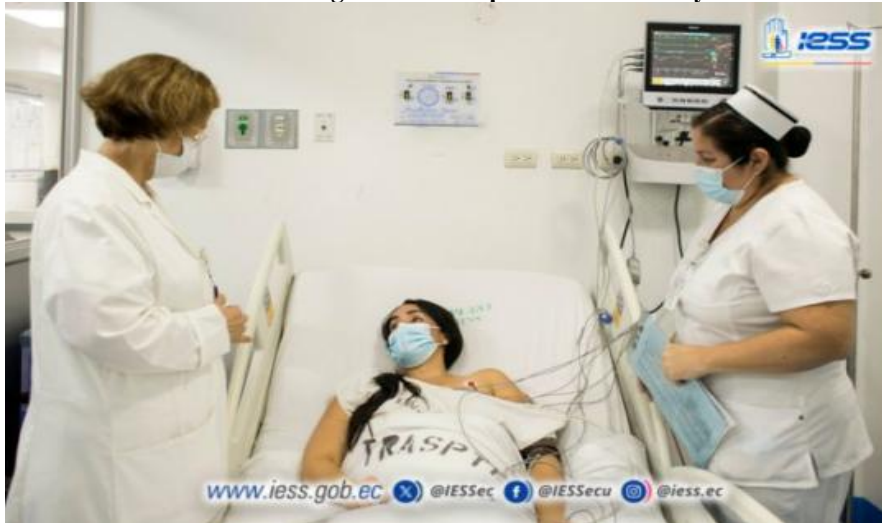
Ilustración 5 - Programa de trasplantes de córnea y riñón

Elaboración: Hospital de Especialidades Teodoro Maldonado Carbo