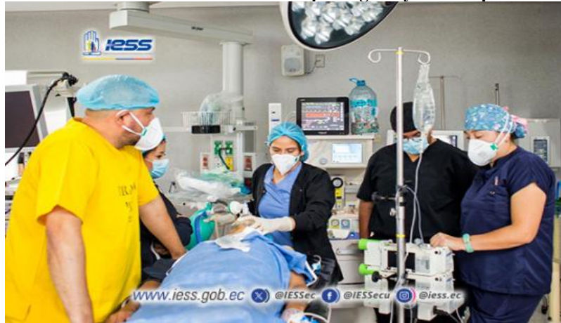
Elaboración: Hospital de Especialidades Teodoro Maldonado Carbo