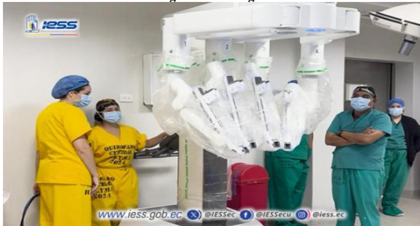
Elaboración: Hospital de Especialidades Teodoro Maldonado Carbo